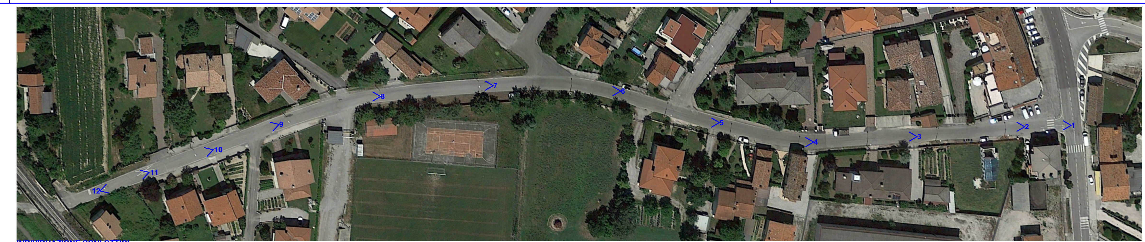
INDIVIDUAZIONE CON OTTICI