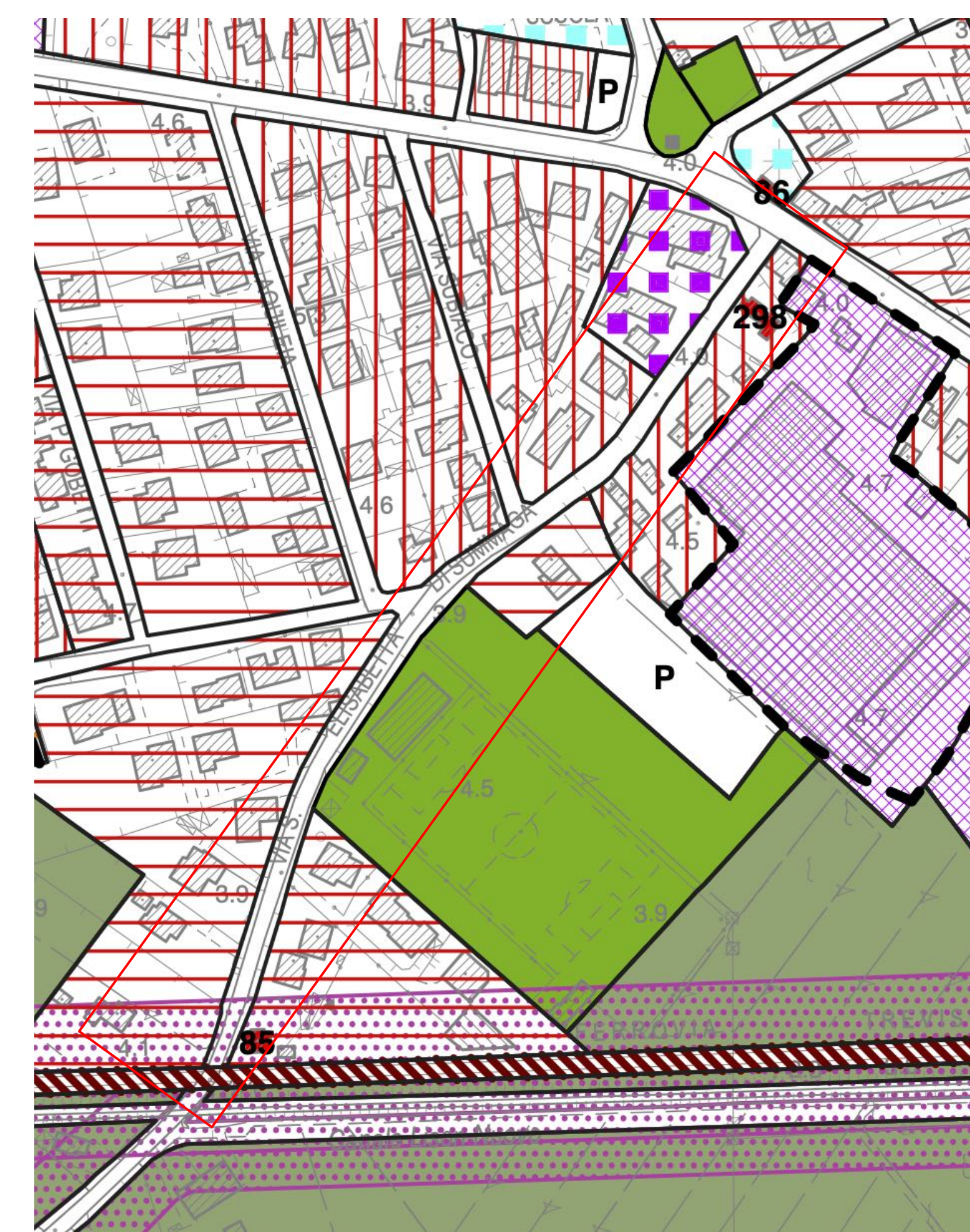
ESTRATTO PIANO DEGLI INTERVENTI - RAPPORTO 1:2000