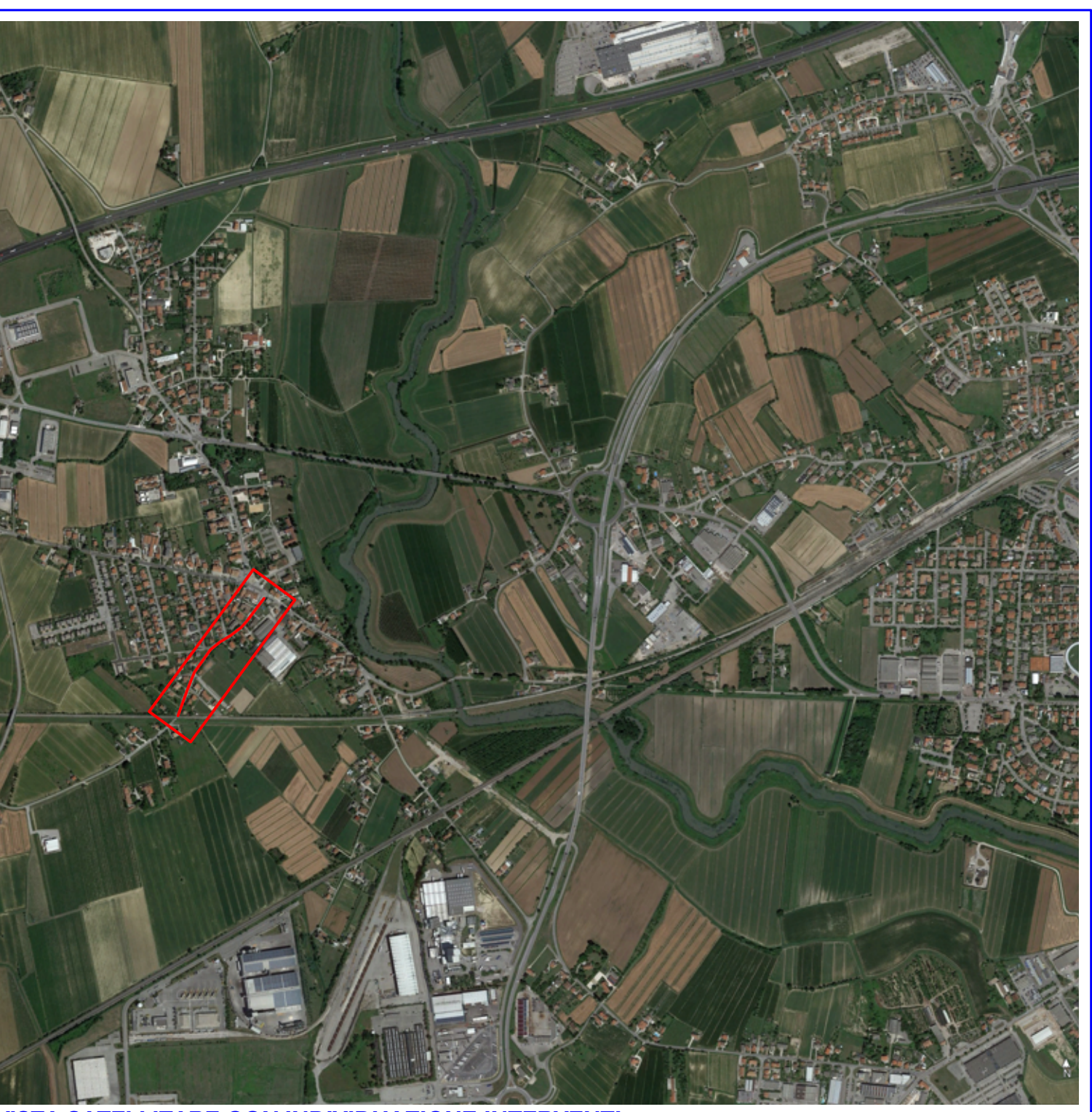
VISTA SATELLITARE CON INDIVIDUAZIONE INTERVENTI