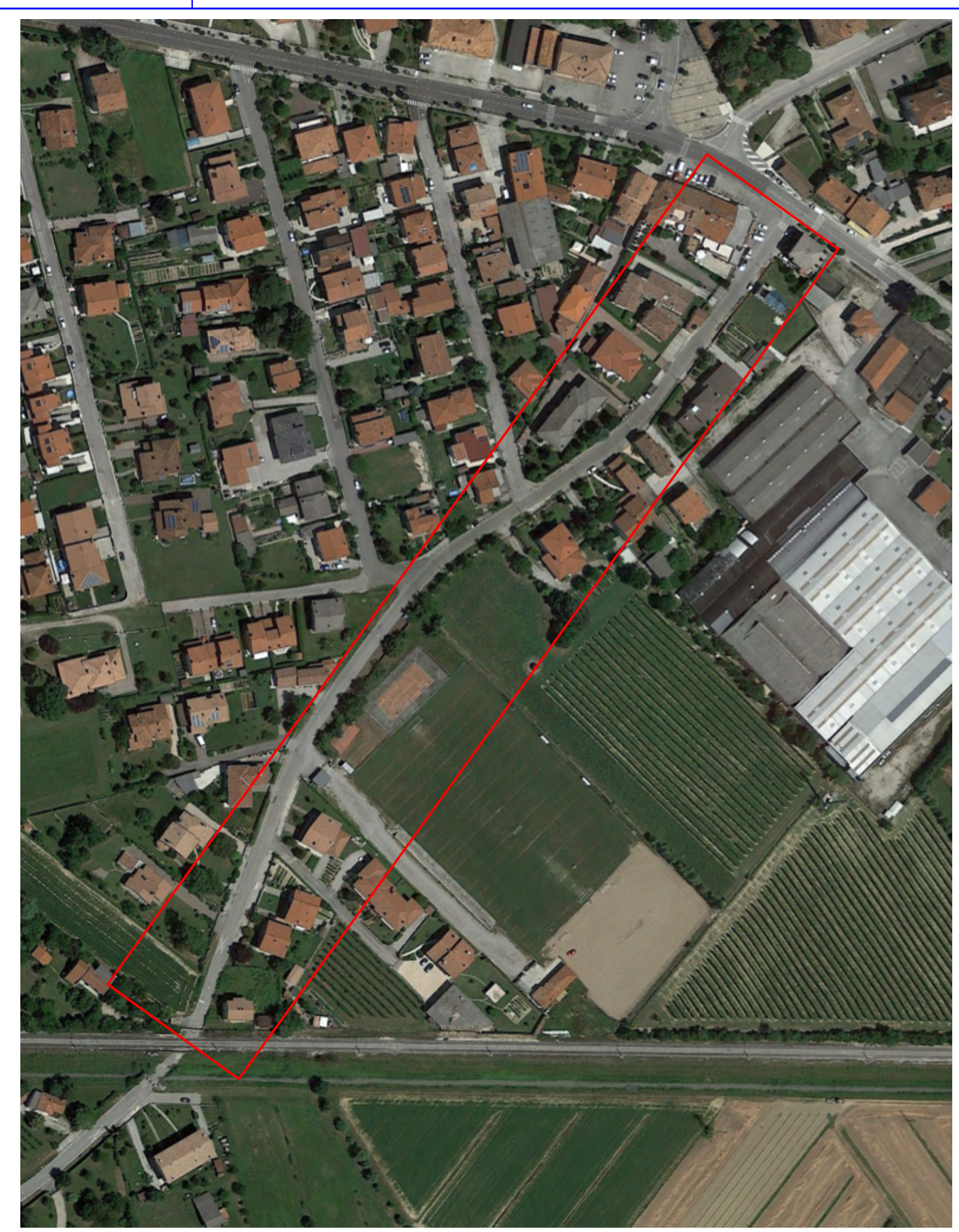
VISTA SATELLITARE - RAPPORTO 1:2000